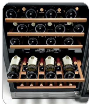
SOAVE / SALENTO