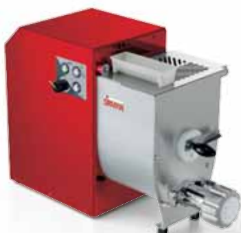
Colore rosso opzionale Optional red colour