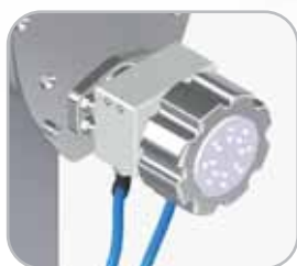
Frio: Kit per raffreddare la bocca opzionale Frio: Optional head cooling kit