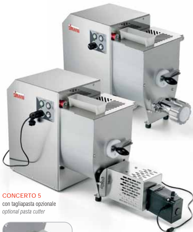
CONCERTO 5 con tagliapasta opzionale optional pasta cutter